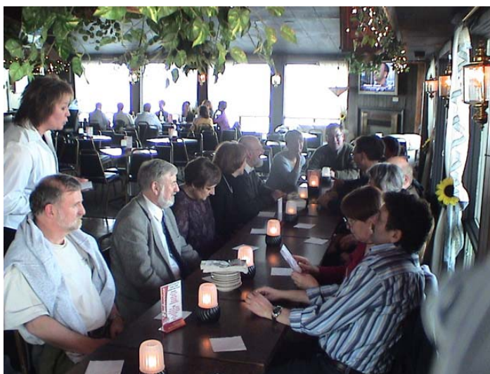
Les délégués se rencontrent pour souper après l'assemblée générale annuelle.